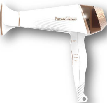
ヘアードライヤー