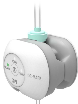
点滴流量機 第33回 中小企業優秀新技術・新製品賞 経済産業省