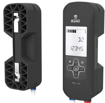
新クランプオン式超音波流量計