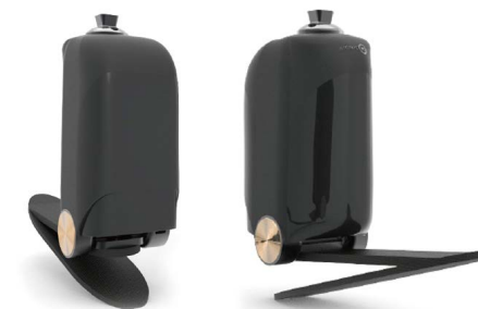
電動アシスト付き義足